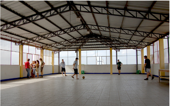
2004: Bau einer Schule für Kinder mit besonderen Bedürfnissen in Pedro Carbo, Ecuador (CRESEM II)