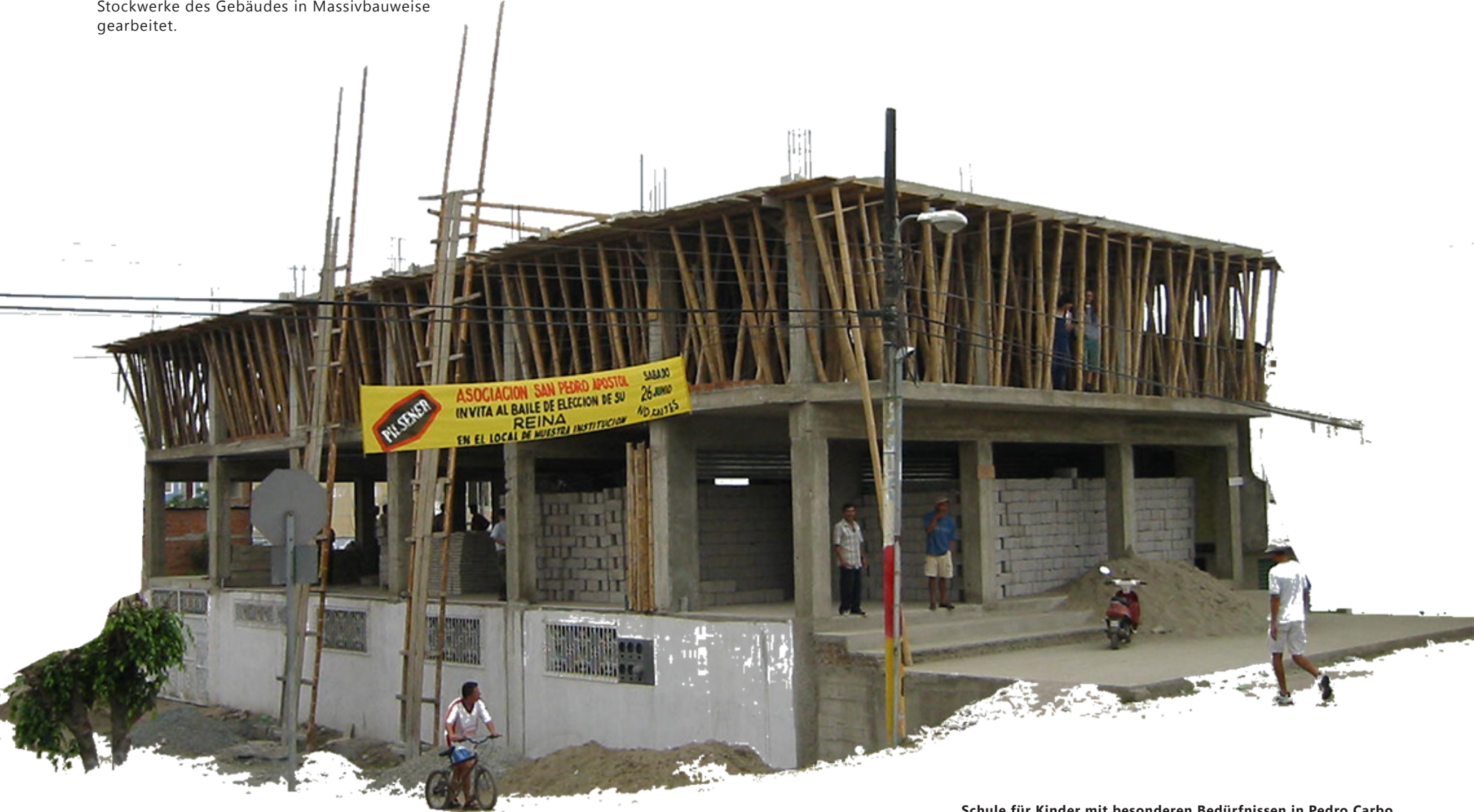
Schule für Kinder mit besonderen Bedürfnissen in Pedro Carbo

In einem dreiwöchigen Projekteinsatz in einem Dorf in der Küstenregion Ecuadors wurde gemeinsam mit ortsansässigen Arbeitern und der finanziellen Unterstützung des EZA (Österr. Entwicklungszusammenarbeit) Vereins an der Fertigstellung der ersten beiden Stockwerke des Gebäudes in Massivbauweise gearbeitet.