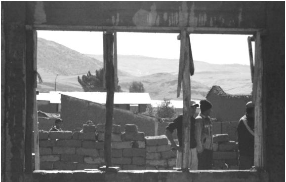
2005: Bau einer Vorschule in Nuñoa, Peru