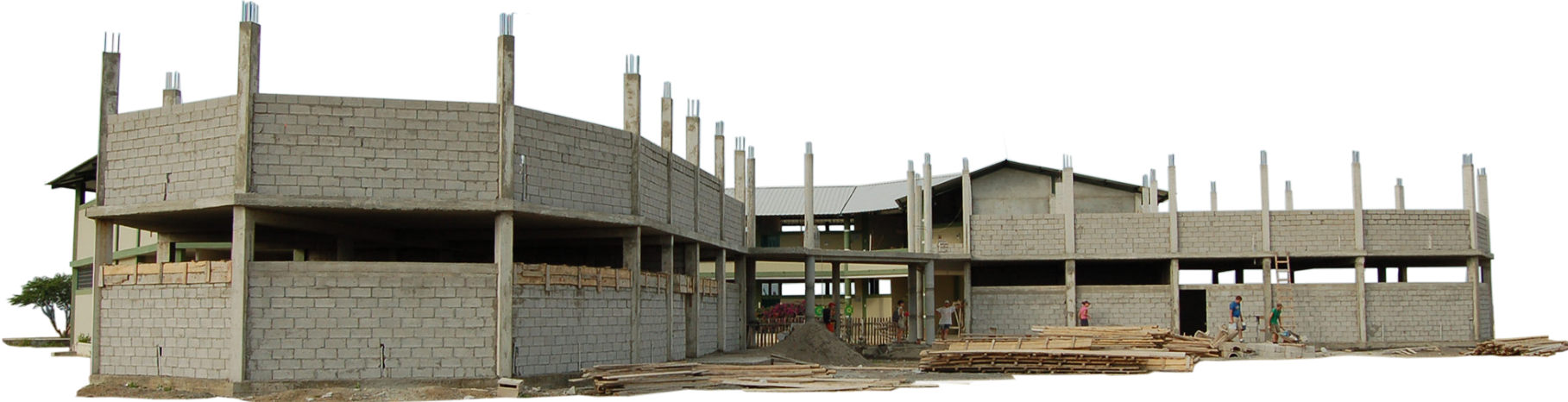
Erweiterung einer Schule in Daule