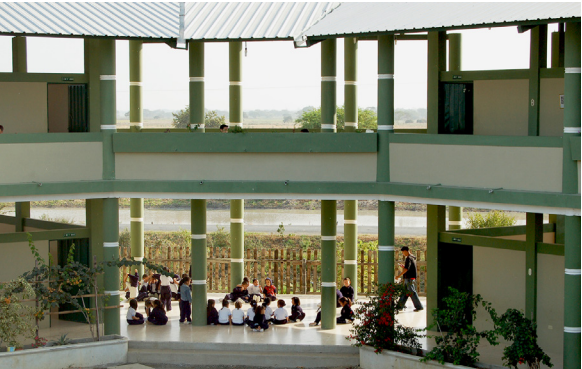
2006: Zubau zweier weiterer Trakte für eine Schule in Daule, Ecuador

In einem dreiwöchigen Projekteinsatz in einem Dorf in der Küstenregion Ecuadors wurde gemeinsam mit ortsansässigen Arbeitern und der finanziellen Unterstützung des EZA (Österr. Entwicklungszusammenarbeit) Vereins an der Fertigstellung der ersten beiden Stockwerke des Gebäudes in Massivbauweise gearbeitet.